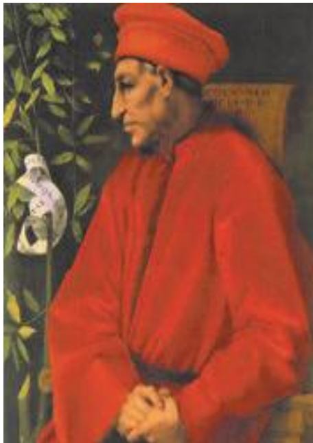
Cosimo de' Medici