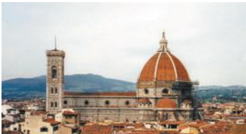
Il Duomo di Firenze Santa Maria del Fiore

3. Guarda le figure e ascolta il testo. Rispondi alla domanda: Di quale periodo storico si tratta?