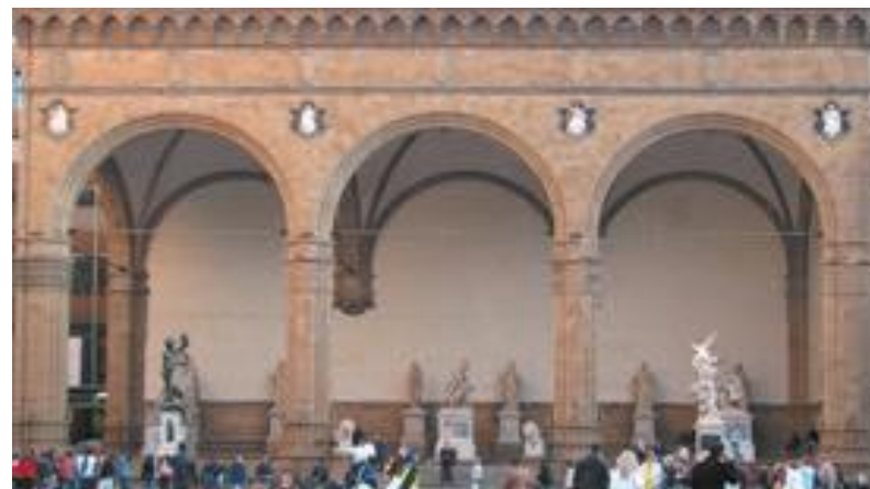
Loggia dei Lanzi