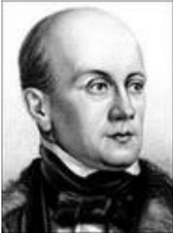
«К Чаадаеву» 1818 год

Формирование гражданина в рабском государстве.