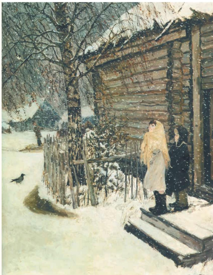
А. А. Пластов Первый снег