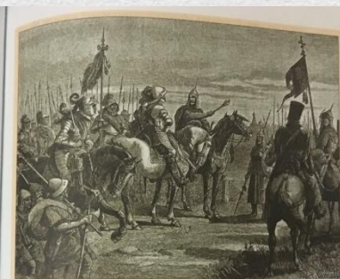
В. Шейн. Князь М.В. Скопин-Шуйский встречает шведского короля Я. Деландера близ Новгорода

Не сумев самостоятельно справиться с Тушинским воеводой, Василий Шуйский обратился за помощью к шведскому королю. В феврале 1609 г. в городе Выборге был заключен договор, по которому шведы предоставляли русскому царю военную помощь и обещали на некоторые северо-западные территории России из Селевчии Шуйский со своим отрядом объединился под Новгородом Десятиречья и выступил с войском в помощь к Москве. К концу января 1610 г. эта объединенная армия очистила от тушинцев территорию от Новгорода до Москвы. Были освобождены Переяславль-Залесский, Александровская слобода, сгоревший в марте 1610 г. был снят осады монастырь. В марте 1610 г. была снята осада Москвы. Тушинский воевода бежал в Калугу.