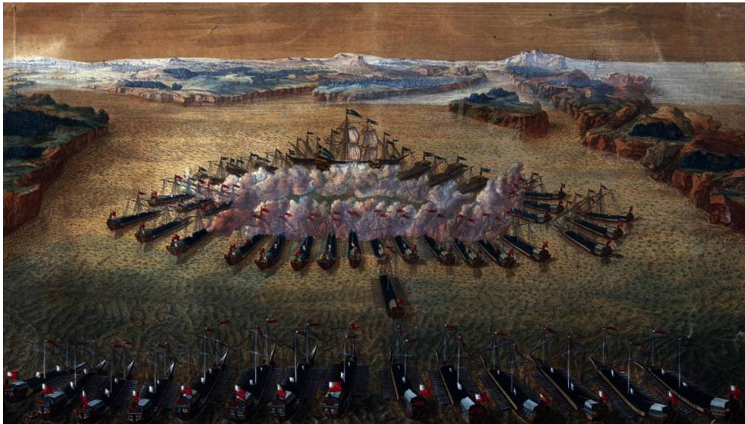
Гангутское сражение. Гравюра М. Бакуа