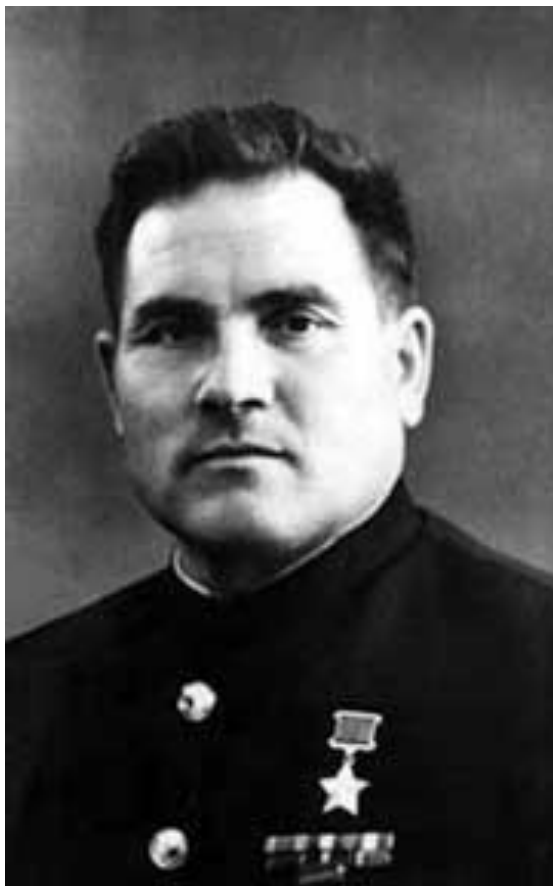
Михаил Петрович Девятаев