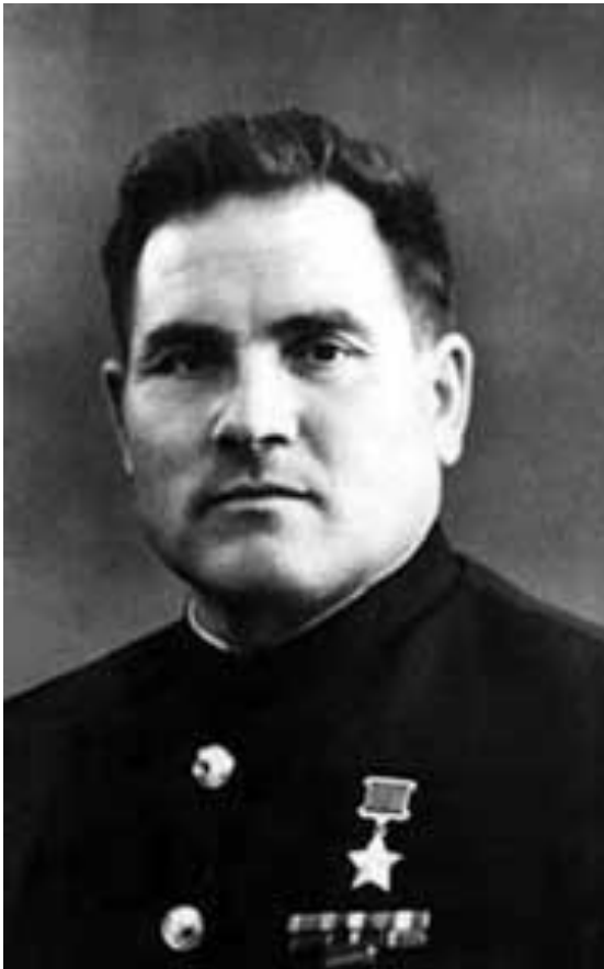
Михаил Петрович Девятаев