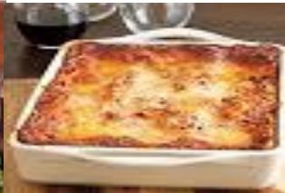
Lasagne al ragu' al forno