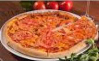
Pizza Margherita quattro formaggi quattro stagioni