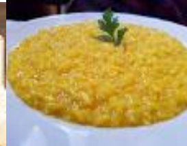
Risotto alla milanese con le verdure ai funghi porcini