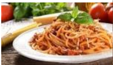
Spaghetti alla bolognese alla carbonara alla matriciana

Многие иностранцы изучают итальянские словари, чтобы читать превосходные рецепты итальянской кухни