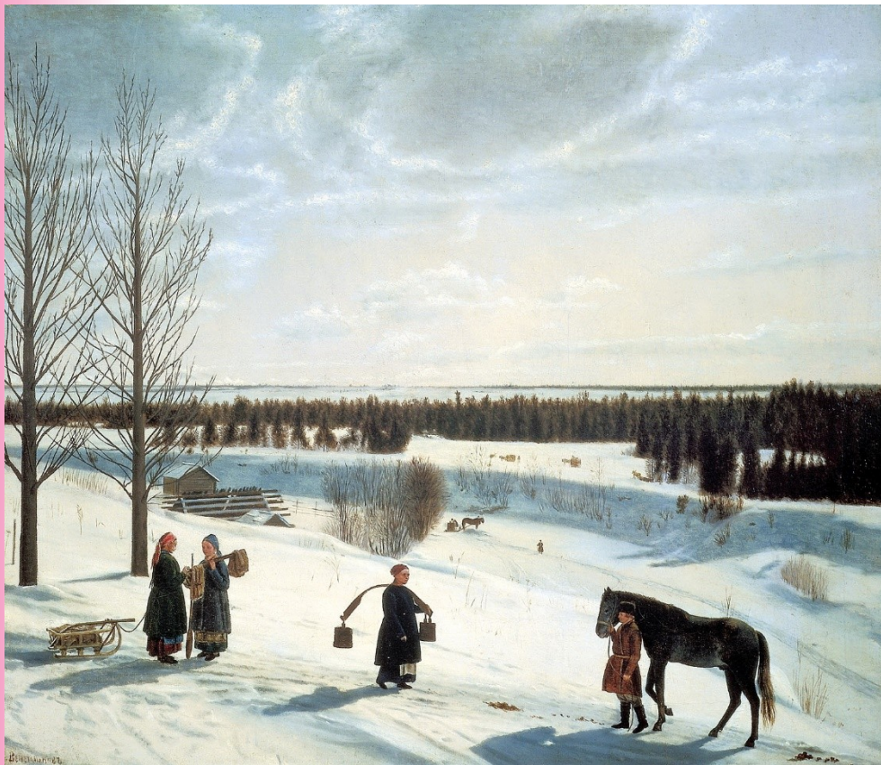
Н. Крылов Зима (фрагмент)