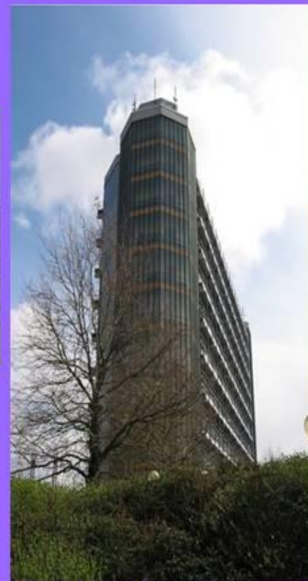
Technischen Universität Dortmund