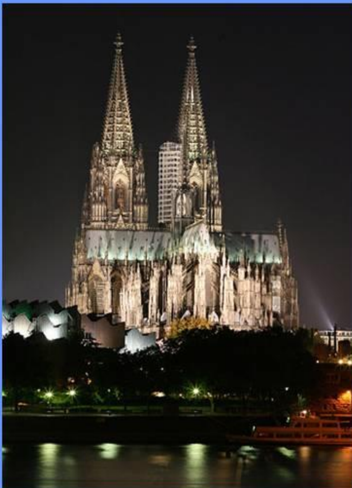
Kölner Dom bei Nacht

Nordrhein-Westfalen ist ein Gebiet mit einer historisch bedingten vielgestaltigen Religionslandschaft. Im Zuge der Konfessionalisierung der frühen Neuzeit nahmen einige Territorien den protestantischen Glauben – mehrheitlich in seiner lutherischen, teilweise auch in seiner calvinistischen Variante – an. Dazu zählten etwa Lippe, Minden Ravensberg, das bergische Land, das märkische Sauerland oder das Siegerland. Andere Gebiete v.a. diejenigen mit einem katholischen Landesherrn blieben katholisch. Dies waren etwa das kölnische Rheinland, das Sauerland, das Münster- und das Paderborner Land. Diese Gliederung blieb über mehrere Jahrhunderte in etwa gleich. In Teilen des Landes führte die Migrationsbewegung des 19. Jahrhundert (Ruhrgebiet) und die Flüchtlingsströme nach dem Zweiten Weltkrieg zu gewissen Verschiebungen. Seit den 1960er Jahren sorgten erneut Migrationsbewegungen aus dem Ausland noch einmal für Veränderungen. Weitere Änderungen sind mit dem Säkularisierungsprozess vor allem nach dem Zweiten Weltkrieg verbunden. Gleichwohl sind insgesamt die in der Reformation entstandenen konfessionellen Grenzen noch immer sichtbar.