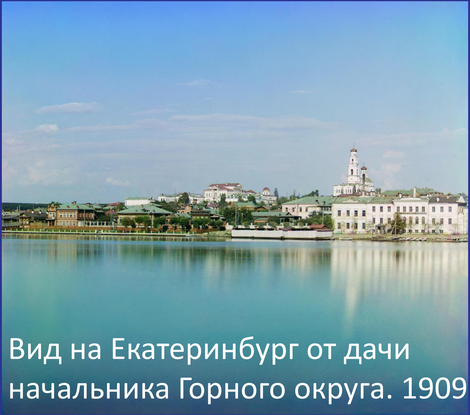
Вид на Екатеринбург от дачи начальника Горного округа. 1909