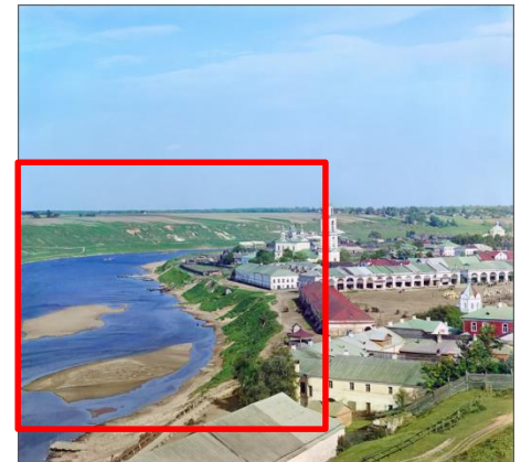
Город Старица. Общий вид с Волгой. 1910