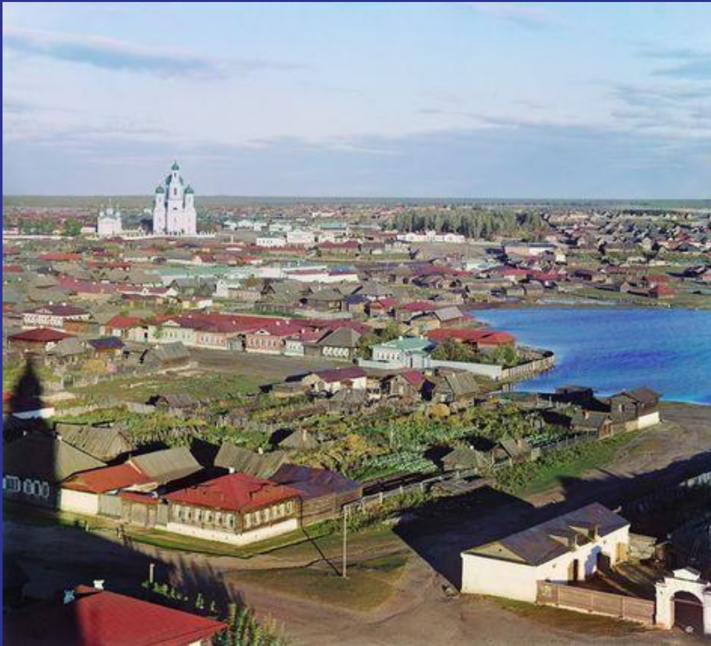
Вид на Касли. 1909