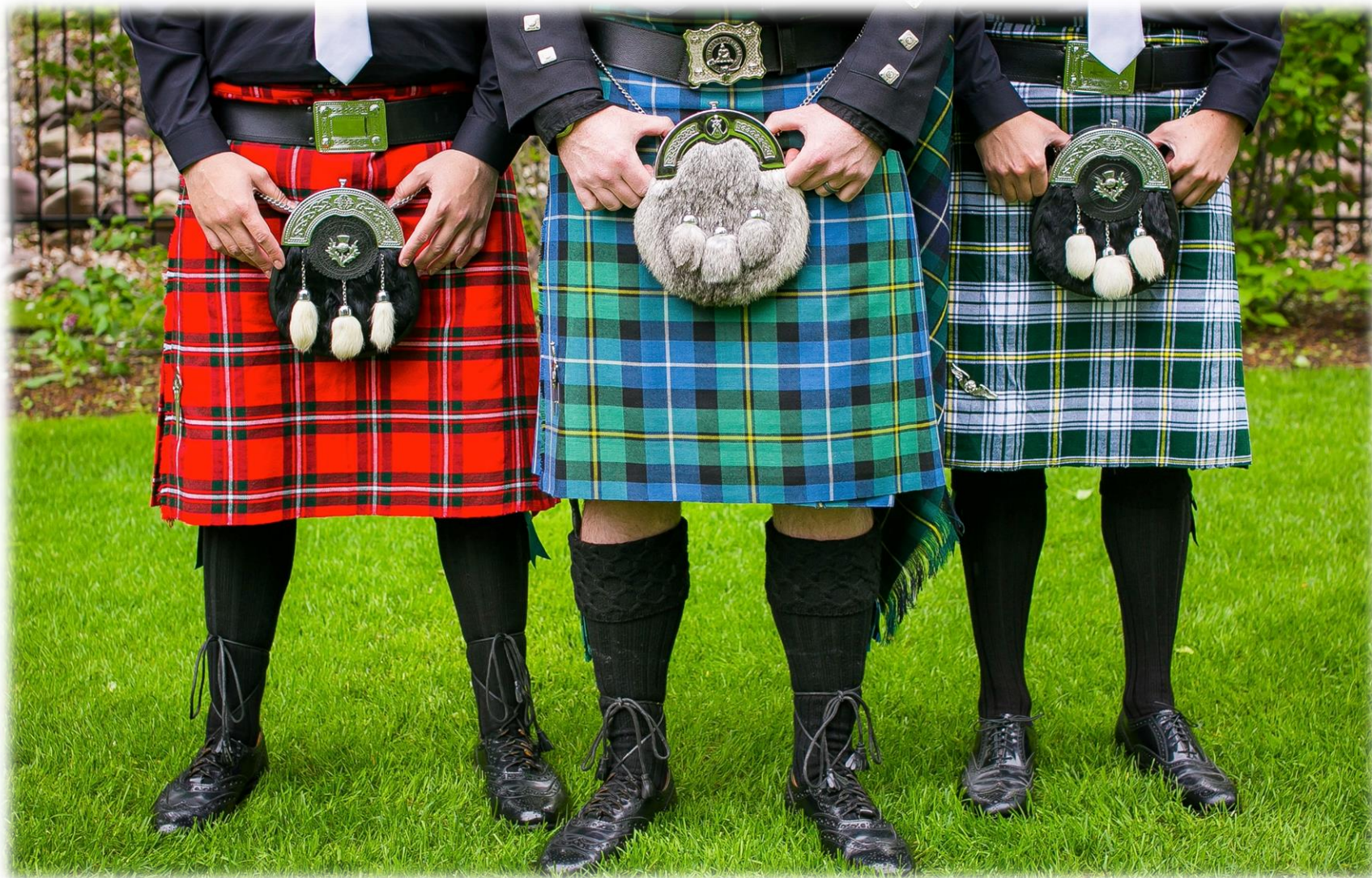
Килт – символ традиции как конструкта