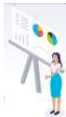
Ранняя цифровая школа