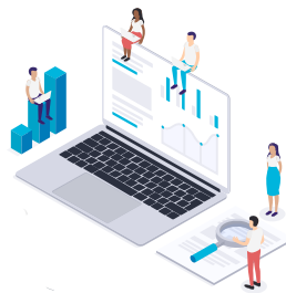
Ранняя сетевая школа