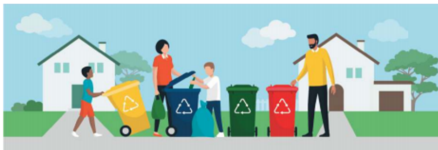
Раздельный сбор мусора