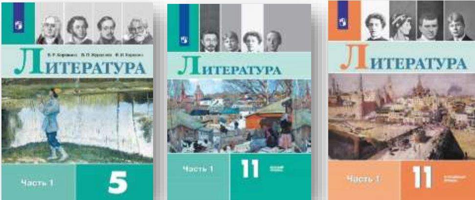
Линия УМК «Литература». В. Я. Коровина