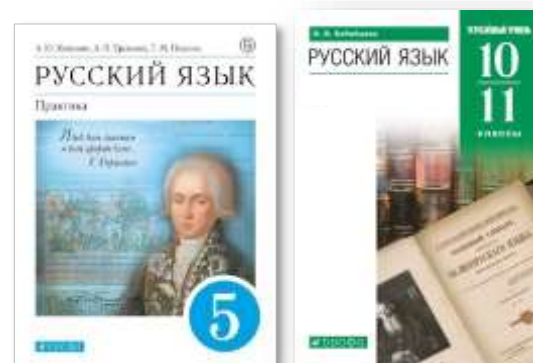
Линия УМК «Русский язык». В. В. Бабайцева