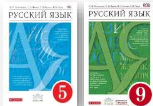
Линия УМК «Русский язык». М. М. Разумовская