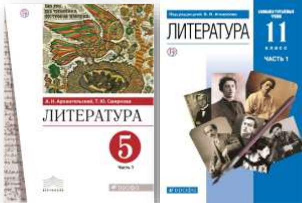
Линия УМК «Литература». А. Н. Архангельский