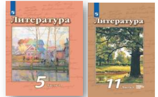
Линия УМК «Литература». В. Ф. Чертов