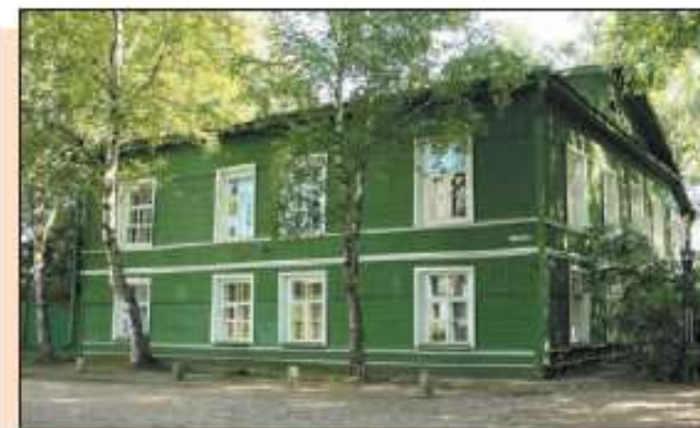
Дом-музей Ф. М. Достоевского в Старой Руссе

Особое место занимает мемориальный Дом-музей Ф. М. Достоевского в Старой Руссе. Эту усадьбу, купленную в 1876 году, писатель считал «своим гнёздом» и приезжал сюда отдыхать со всей семьёй.