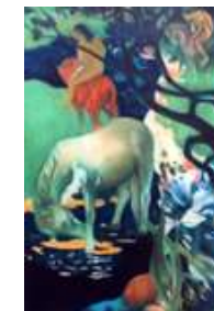
Поль Гоген. БЕЛАЯ ЛОШАДЬ. 1898.