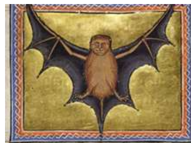
Летучая мышь. Средневековье. Абердинский bestiарий