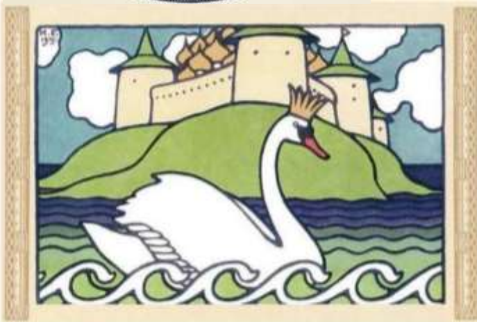
Глядь – поверх текучих вод Лебедь ...

Иллюстра́ция (от лат. illustratio — освещение, наглядное изображение) — рисунок, фотография, гравюра или другое изображение, поясняющее текст. Художника, выполняющего иллюстрации к тексту, называют иллюстра́тором. Википедия