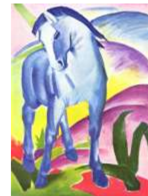
Франц Марк. СИНИЙ КОНЬ. 1911

Некоторые из самых ранних изображений были вырезаны на стенах пещер более 40 000 лет назад.