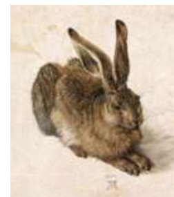
Альбрехт Дюрер. КРОЛИК. 1502.