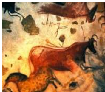
Наскальные рисунки. Пещера Ласко. 18 в. до н.э.

История изобразительного искусства свидетельствует об изменении способов изображения животных художниками.