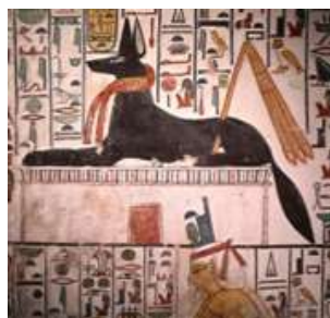
Анубис. Фреска. Др. Египет