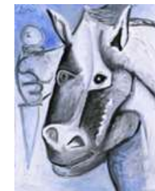
Пабло Пикассо. БЫК. 1962.

Произведения изобразительного искусства – живопись, графика – «корреспонденты», свидетели истории, отражают стиль эпохи.