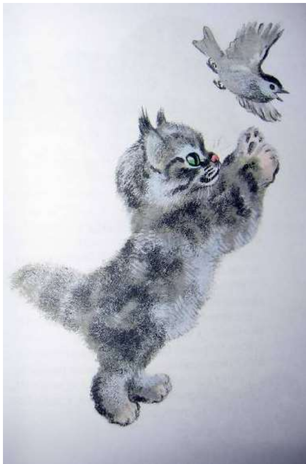
Евгений Чарушин. Иллюстрация к книге «Тюпа и Томка». КОТЁНОК ТЮПА ЛОВИТ ПТИЧКУ. https://www.labyrinth.ru/screenshot/goods/255503/24/