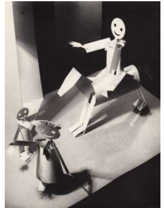
Александр Родченко. Фотоиллюстрация книге «Самозвери».1926. Поздний серебряно-желатиновый отпечаток. Частное собрание

На занятиях во ВХУТЕМАСе регулярно проводили эксперименты с бумажными формами. Пластические возможности бумаги позволяли художникам переводить композиции из плоского изображения в пространственные конструкции. Пример такой трансформации – «Самозвери» Александра Родченко и Варвары Степановой. Это бумажные фигурки детей и зверей, которые были созданы в качестве иллюстраций для детской книги Сергея Третьякова. Но художники захотели сделать нечто большее – не просто иллюстрации, а раскадровку анимационного фильма, целую игру, в которой могли принять участие и сами маленькие читатели. Фигурки собирались из бумажного модульного конструктора, который позволял детям создавать своих героев и разыгрывать различные истории.