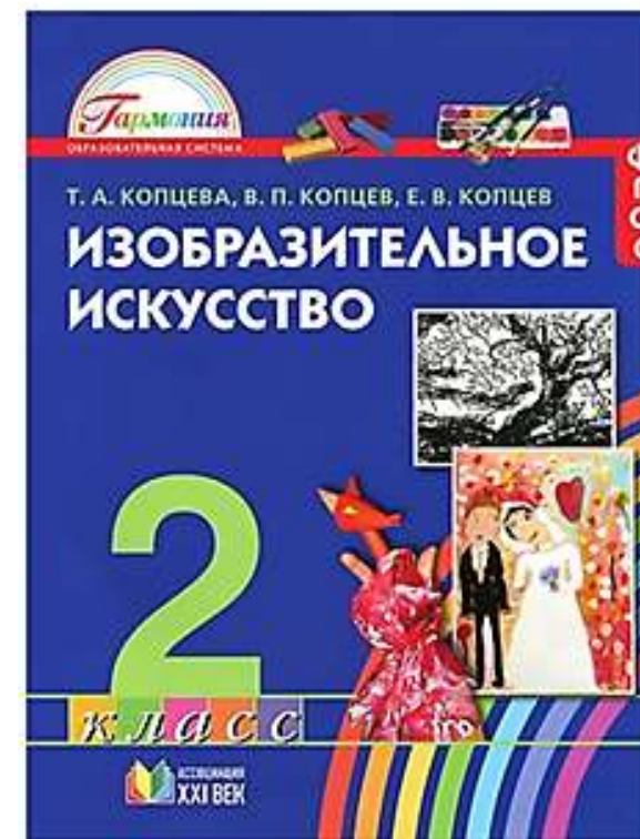
Учебник 2 класс