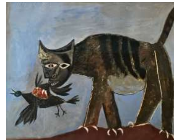
Пабло Пикассо. КОШКА, ПОЙМАВШАЯ ПТИЦУ. 1939 https://www.everypainterpaintshimself.com/index.php?/article/picassos_cat_cat_hing_a_bird_1939

Покажите 2-3 произведения изобразительного искусства на уроке. Выразительная художественная форма обычно не оставляет учеников равнодушными. Вдохновленные увиденными изобразительными образами, они создадут свой. Установка на творчество в многогранных формах его выражения – важное условие урока искусства. Какие произведения показывать в 1-4 классе?