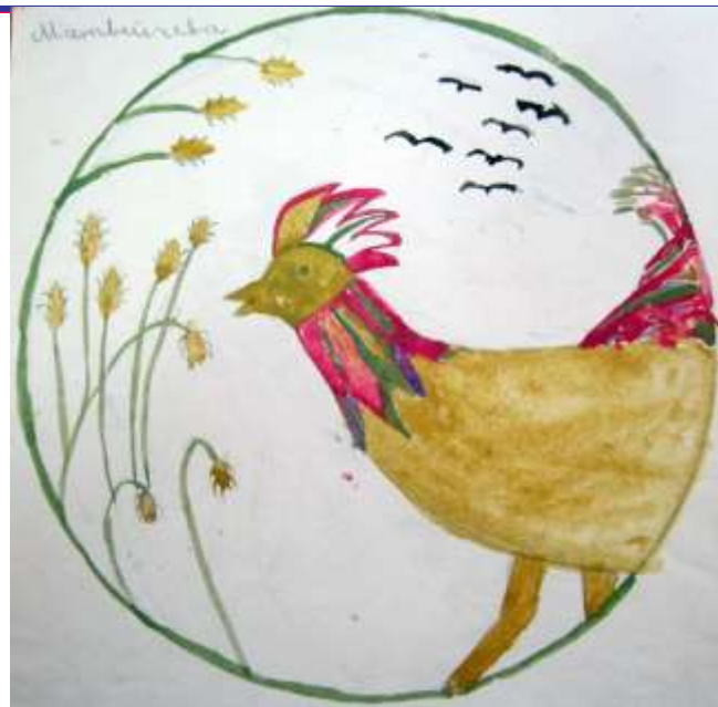
Рисунки 1950-60-ых гг. из Международной коллекции детского рисунка ФГБНУ ИХОиК РАО. П. 123, №№166, 6,207