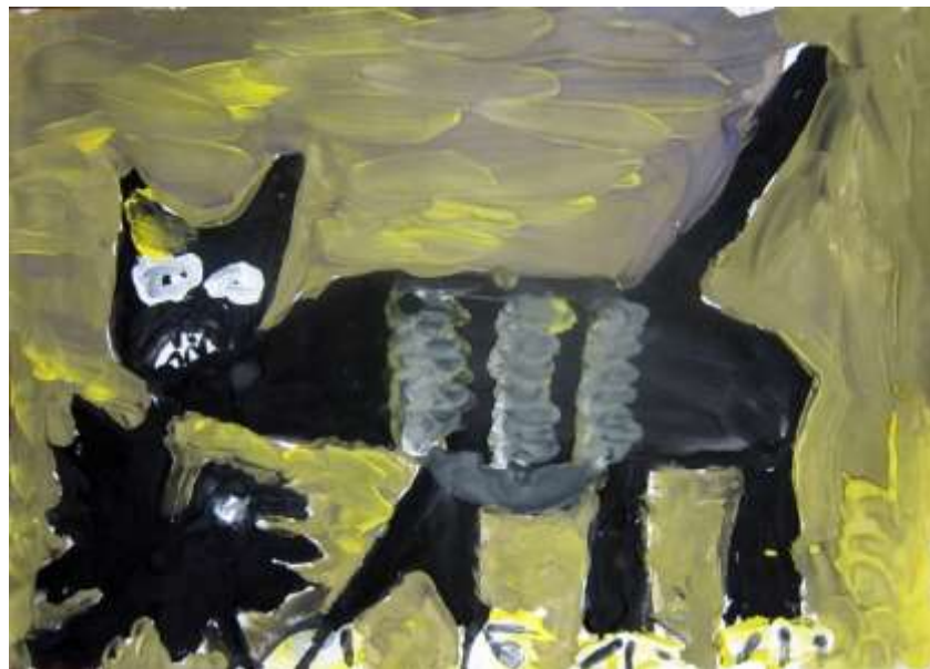
Доронина Ладимира, 6 лет. КОШКА ПОЙМАВШАЯ ПТИЦУ. Москва, педагог Фомина О.Н. Передвижная выставка «Музей и мы»

Покажите 2-3 произведения изобразительного искусства на уроке. Выразительная художественная форма обычно не оставляет учеников равнодушными. Вдохновленные увиденными изобразительными образами, они создадут свой. Установка на творчество в многогранных формах его выражения – важное условие урока искусства. Какие произведения показывать в 1-4 классе?