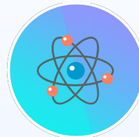
Схема ответа на вопрос (опыт + пример)