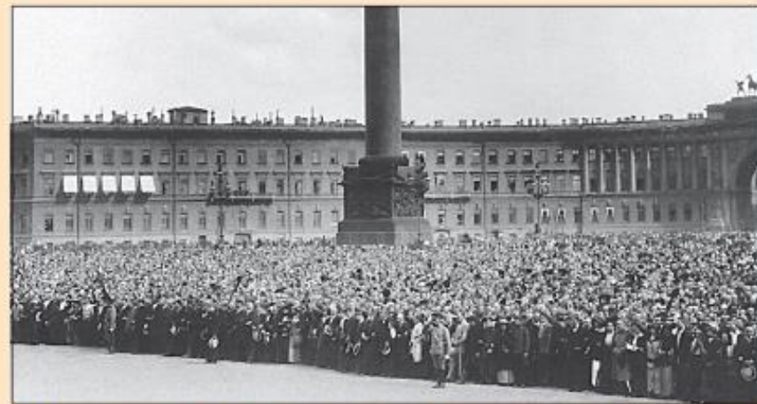
На Дворцовой площади в момент провозглашения Манифеста о вступлении в войну. Санкт-Петербург. 20 июля 1914 г.

С самого начала войны в России провозгласили Германской, Великой, Второй Отечественной. Патриотические настроения в обществе ободрили царя. Казалось, в народе наступило единодушие. 20 июля (2 августа) 1914 г. в Петербурге на Дворцовой площади прошла манифестация в поддержку войны под лозунгами солидарности со славянскими народами и защиты их от тевтонской агрессии. А когда император и императрица вы шли на балкон Зимнего дворца, десятки тысяч людей дружно опустились на колени. Манифестанты с воодушевлением спели гимн «Боже, Царя храни!». В тот же день вышел царский Манифест, в котором подчёркивались традиционное миролюбие России и агрессивность Германии. Документ призывал всех россиян забыть внутренние распри, «оградить честь, достоинство, целостность России и положение её среди великих держав».