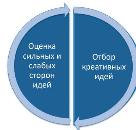
Оценка и отбор идей