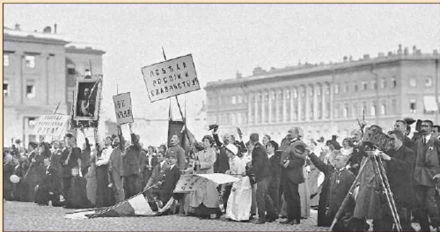
Толпа на Дворцовой площади Петербурга в ожидании объявления Манифеста о начале войны. 1914 г.