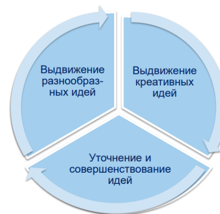
Выдвижение и совершенствование идей