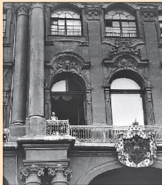
Николай II на балконе Зимнего дворца перед провозглашением Манифеста о вступлении в войну. Санкт-Петербург. 20 июля 1914 г.